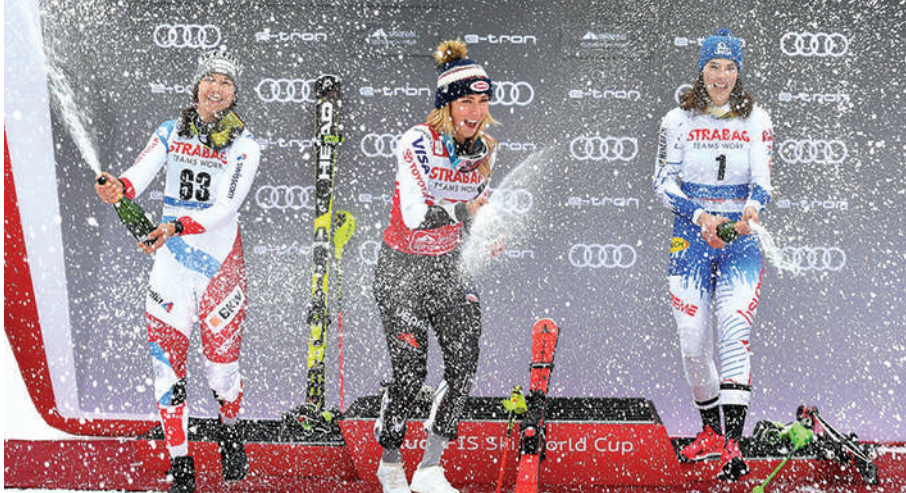
Nejrychlejší ženy slalomu SP ve Špindlu