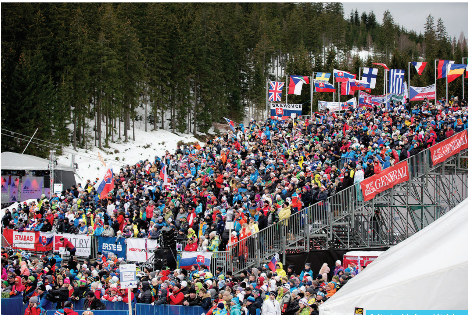
Světový pohár žen - obřím slalom